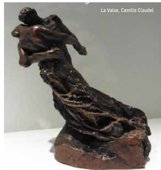
La Valse, Camille Claudel

Découvrez lors de ces conférences les mille et une facettes de la création artistique ancienne et contemporaine en lien avec les expositions de la Maison des arts plastiques.